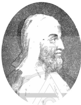
Ο ΠΛΟΥΤΑΡΧΟΣ W. Ridley εχάραξε, 1826 (Βιβλιοθήκη Δημ. Γούναρη)

Ολόκληρη η δοθείσα στον «Παρνασσό» διάλεξη.