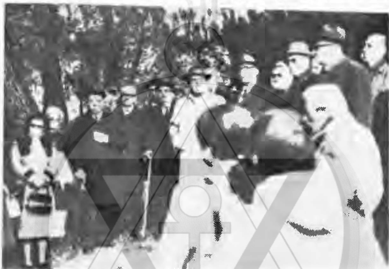
Μία ομάδα των εφετειῶν ἐκδρομίων

Τὸ Διοικητικὸν Συμβούλιον τοῦ Ἀρχαιοφίλου Ὁμίλου Ἐκδρομῶν καὶ τὰ μέλη αὐτοῦ, πιστοὶ τηρηταὶ τῶν ἐντολῶν τῶν ἰδρυτῶν, καὶ σήμερον προσῆλθον εἰς τὸν ἱερόν τουτον χωρὸν διὰ νὰ ἑορτάσουν μὲ εὐχαρίστησιν τὴν ἐπέτειον ἀπὸ τῆς ἰδρύσεώς του.