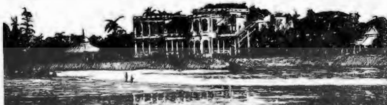
Άποψις τής έδρας τής Παγκοσμίου Θεοσοφικής Έταιρίας στο Άντυαρ