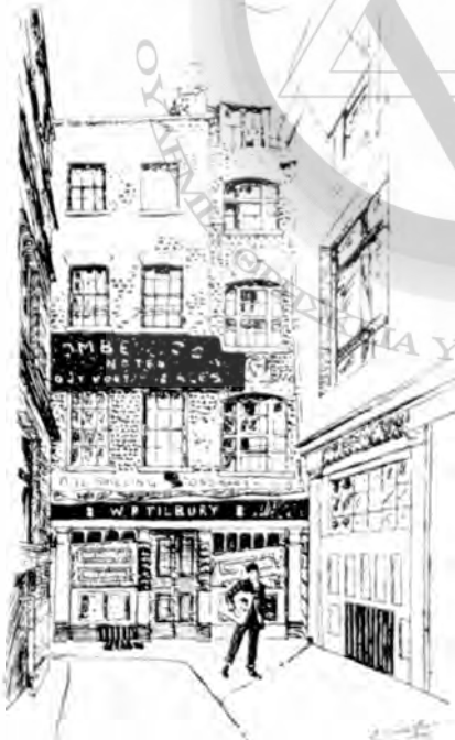
Τό ζυθοπωλείον «της Χήνας και της Έσχάρας», όπου έγινε η πανηγυρική συνεδρίασις προς ίδρυσιν της Μεγάλης Στοάς της Άγγλιας.

τρέχοντος του 17ου αιώνας, διότι εις τό πρακτικόν περι ιδρύσεως της Μεγάλης Στοάς αναφέρεται ότι ή απόφασις των τεσσάρων αρχαίων στοών ύπηγορεύθη εκ του τερματισμού της «Ανταρσίας», νοουμένης της αποκαταστάσεως όμαλότητος εις την χώραν, είναι δέ γνωστόν ότι τό 1715 έσημειώθη έξέγερσις των Τόρυδων προς έγκατάστασιν εις τόν θρόνον απογόνου των Στούαρτ, αντί του από του έτους 1714, ένθρονισθέντος Γεωργίου του Α΄, εκ της δυναστείας του Άννοβέρου. Όπωσδήποτε, ή μία εκ των τεσσάρων αρχαίων στοών, αι όποιαι ίδρυσαν την Μεγάλην Στοάν της Άγγλιας, ή και «Στοά της Αρχαιότητος» καλουμένη, συνεδριάζουσα δέ εις τό ζυθοπωλείον «της Χήνας και της Έσχάρας» και αναφερομένη ως λειτουργούσα «από μη ένθιμο υμ έν ης συστάσεως», ήτο, κατά πāσαν πιθανότητα, έξελικτική μορφή αρχαίας επαγγελματικής τεκτονικής στοάς. Δέν έξηγεΐται διαφοροτρόπως ό τίτλος της και ό περι καταγωγής ισχυρισμός, δοθέντος ότι, ως προκύπτει εκ χαραχθέντος πίνακος του έτους 1729, αναφέρεται τό 1691 ως έτος συστάσεως της υπ΄ αριθ. 1 στοάς ταύτης. Έπειδή όμως ή χρησιμοποιηθείσα σφύρα κατά την συμβολικήν θεμελιωσιν του Άγίου Παύλου έδόθη από τόν βασιλέα Κάρολον Β΄ εις τόν διάσημον αρχιτέκτονα