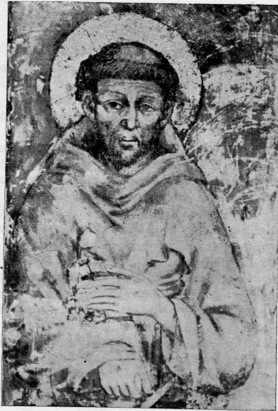
ΤΣΙΜΑΜΠΟΥΕ (1240-1302) Ο ΑΓΙΟΣ ΦΡΑΓΚΙΣΚΟΣ ΜΕ ΤΑ ΣΤΙΓΜΑΤΑ