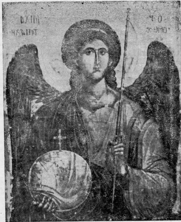
Ο ΑΡΧΑΓΓΕΛΟΣ ΜΙΧΑΗΛ

είκόνα του ΙΔ' αιώνα. Βυζαντινό Μουσείο, 'Αθήνα