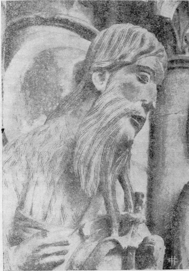
Ο ΑΓΙΟΣ ΙΩΑΝΝΗΣ Ο ΒΑΠΤΙΣΤΗΣ

γλυπτό τοῦ βόρειου πυλώνα τῆς μητρόπολης τῆς Σάρτρ