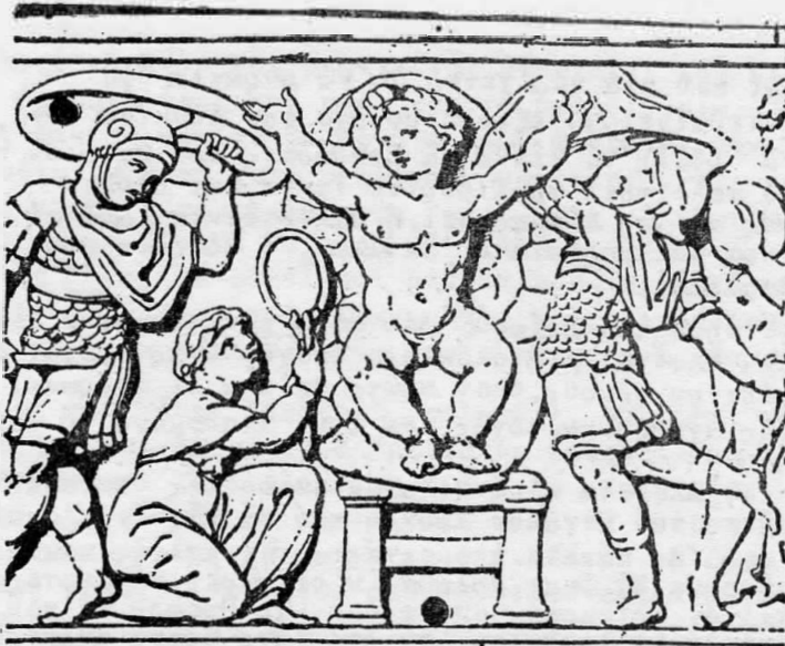
ΠΑΡΑΣΤΑΣΗ ΤΟΥ ΕΝΘΡΟΝΙΣΜΕΝΟΥ ΘΕΙΟΥ ΒΡΕΦΟΥΣ